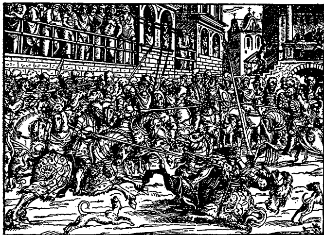
(34) Op. cit. p. 75.

La segunda clase duró apenas siete años, hasta que fue cerrada por orden de Napoleón e 1803, y sustituida por la de lenguas orientales. Después de la Revolución de 1830 será restablecida de nuevo con el nombre de Academia de ciencias morales y políticas.