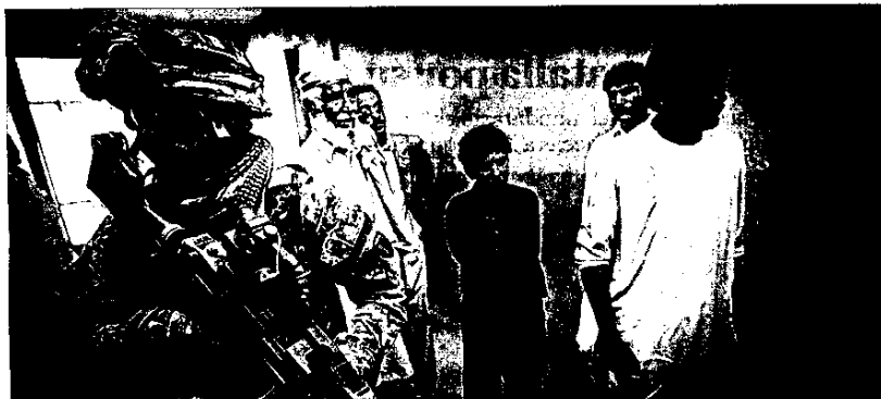
El presidente de Estados Unidos asume la realidad y dice que "no intentaremos hacer de Afganistán un lugar perfecto".